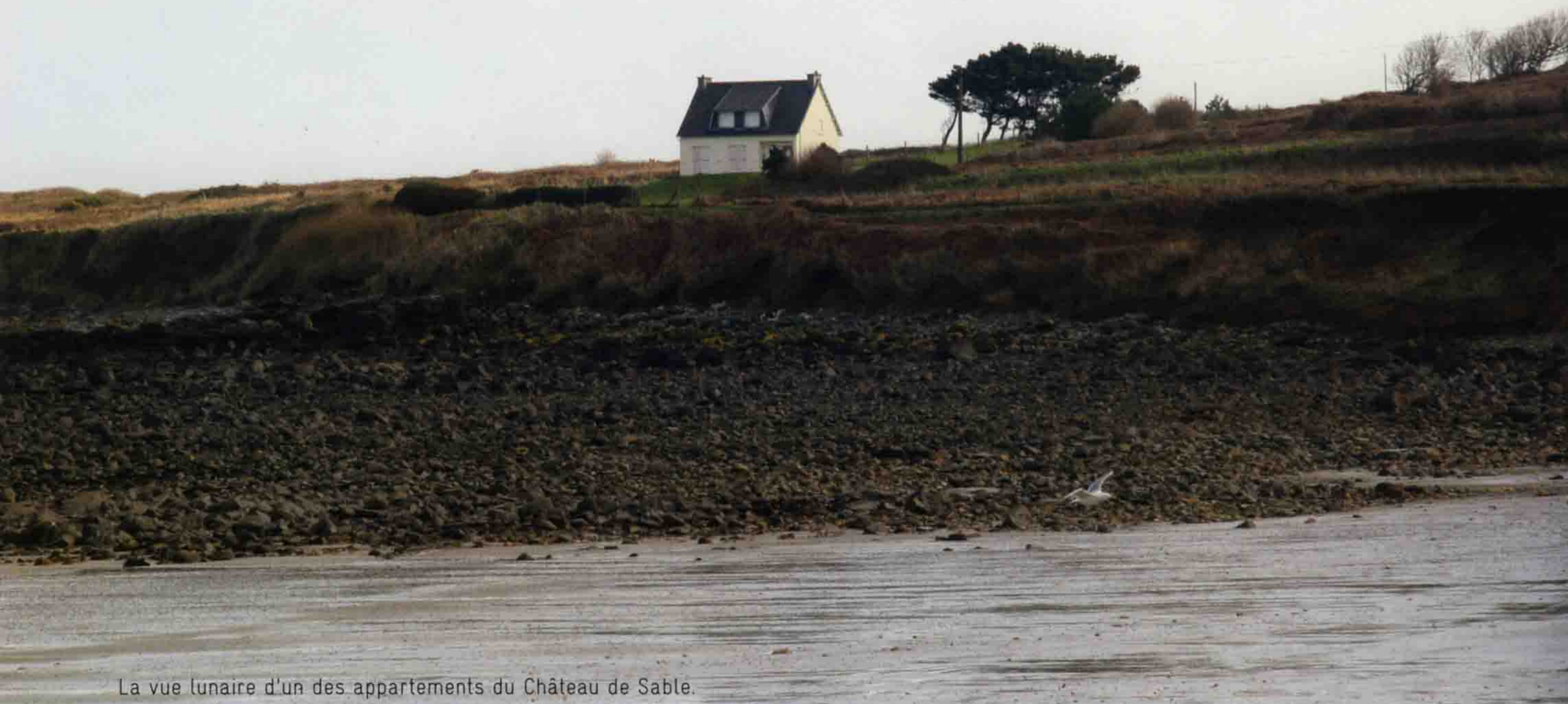
La vue lunaire d'un des appartements du Château de Sable.

Aux étages, les appartements au nombre de dix portent les noms de la ribambelle d'enfants des propriétaires : vous séjournerez chez Arnaud, Ambre, Louis... Chaque appartement dispose d'une cuisine, équipée de chez équipée, ouverte sur le séjour, d'une chambre pour les parents et une autre pour les enfants. Le fonctionnel prend ici des allures de design. Le sable, le Nutella et les aller-retours des enfants n'auront pas raison de ces appartements conçus pour les familles – la vôtre aussi, si ! si ! La décoration est volontairement simple et sobre pour que le plus beau des éléments, la mer, soit en vedette. Les tons sont dans les sable avec quelques touches de rouge – chaises Panton – ou de vert pomme – poufs Fatboy – par ci par là. Tout ici participe à une désintoxication à l'iode.