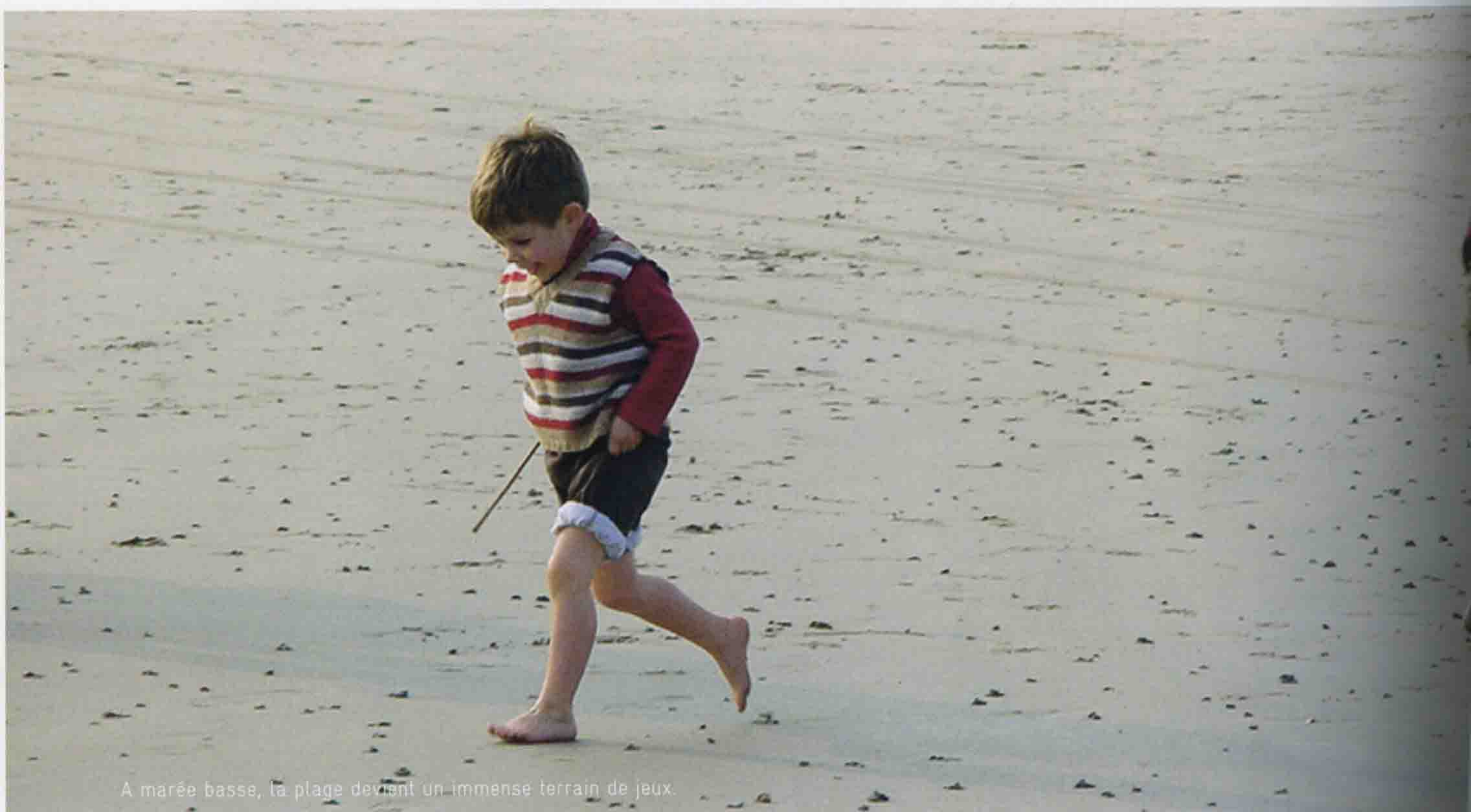
A marée basse, la plage devient un immense terrain de jeux.

Une maison hantée des esprits les plus élégants du début de siècle dernier : Nina Ricci, Fréhel... L'esprit du grand hôtel Limbour, construit en 1930, devient pour votre famille le Château de Sable, une maison de vacances en Bretagne, à Morlaix.