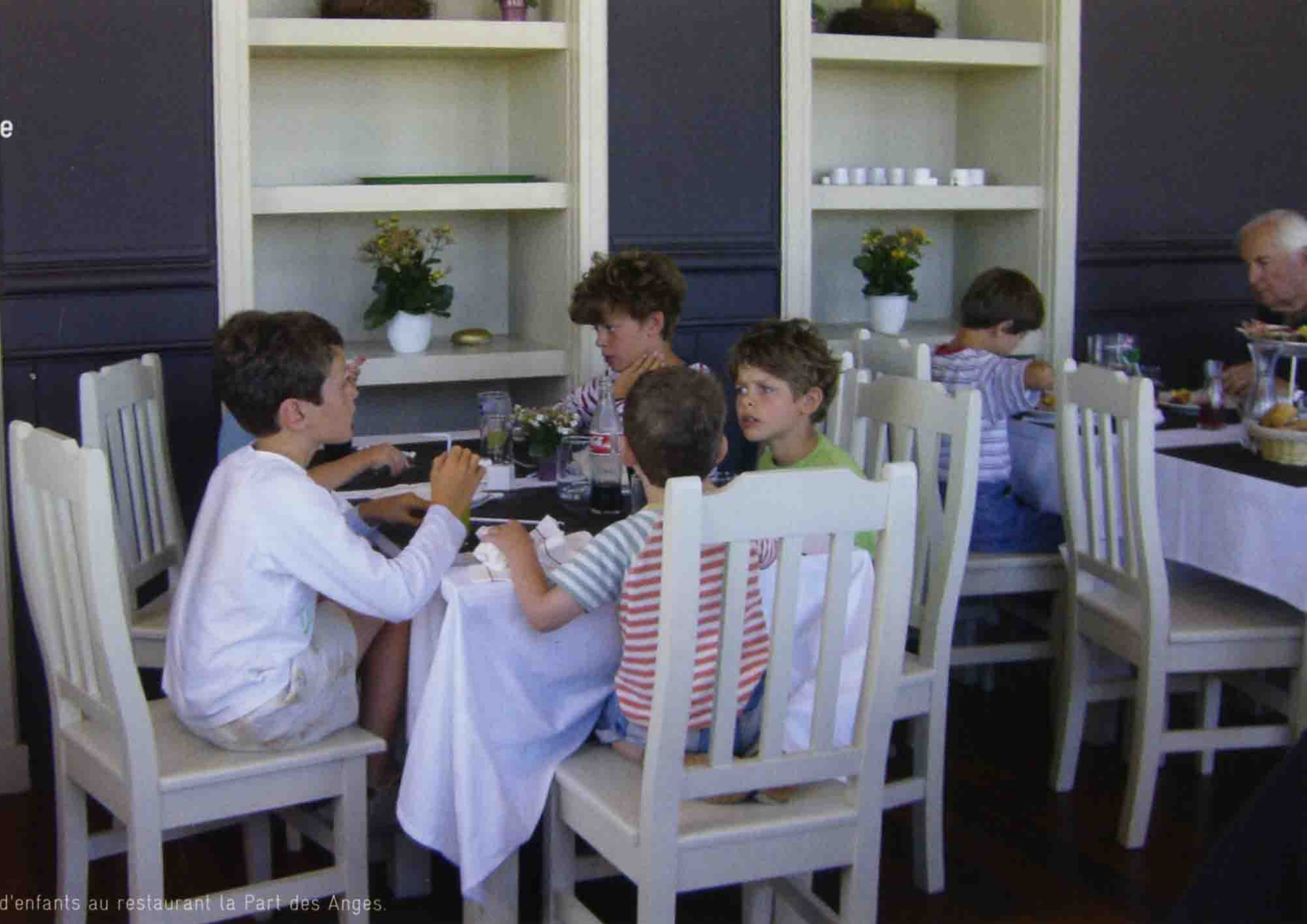
Une tablée d'enfants au restaurant la Part des Anges.

Passer des vacances en famille, pour faire une pause verte et bleue. Purée-jambon pour les nains, et fruits de mer pour vous. Vue sur la mer ; voilà ce que nous vous proposons pour les vacances de Pâques : une parenthèse.