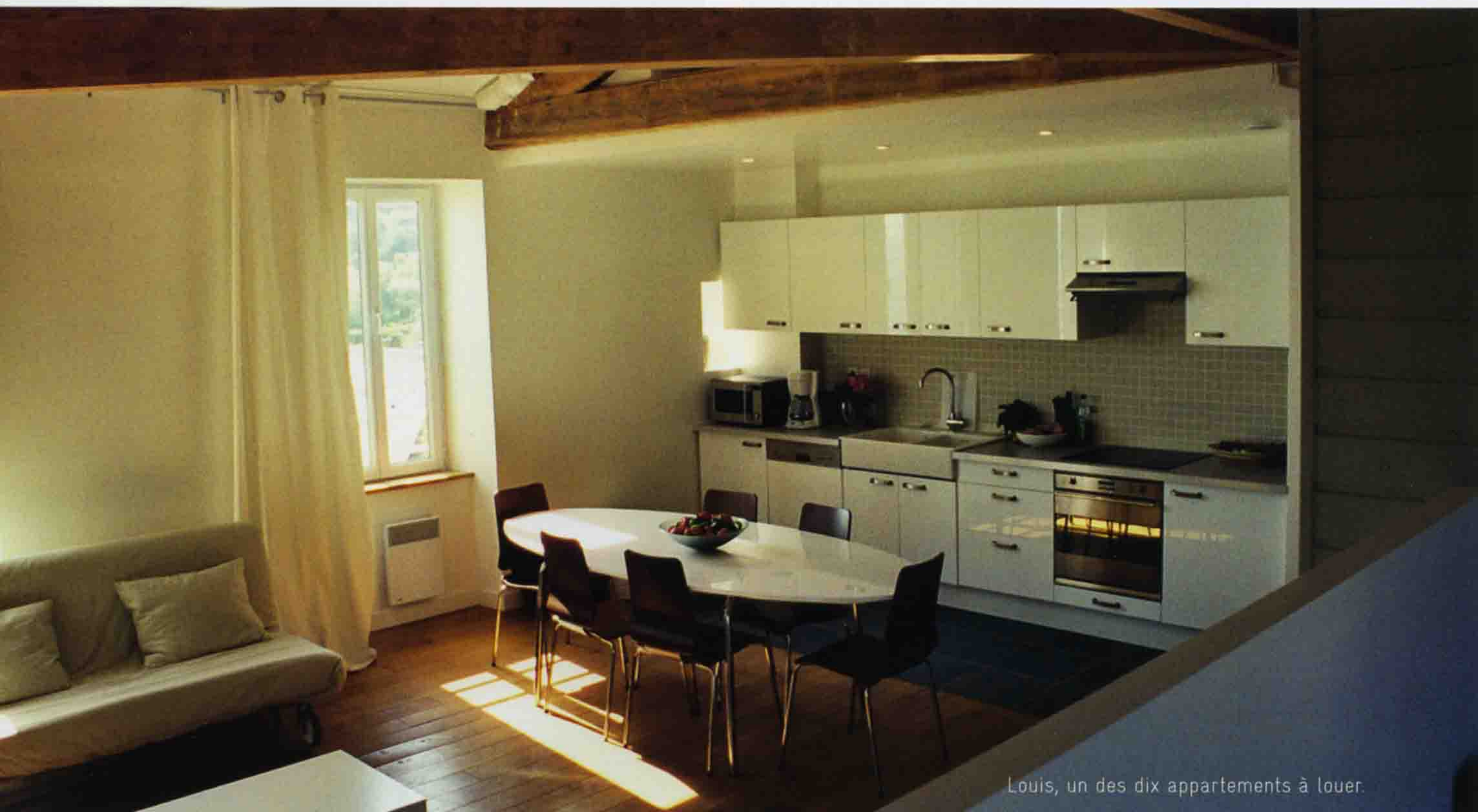
Louis, un des dix appartements à louer.

Si l'hôtel a gardé son allure 1930, un tourbillon d'intelligente modernité a fait son show à l'intérieur. Les murs du rez-de-chaussée sont brun chocolat (chaud), parsemés de créations collantes Wall Design. La salle de réception garde ce petit air snob de son passé de Grand Hôtel grâce à cette copie de fresque du peintre morlaisien Kerga, l'original étant au Musée des Beaux-Arts de Rennes. La cuisine est l'affaire d'un enfant du pays, Mikael Gallien, qui officie au restaurant «La Part des Anges», pour que vos dîners estivaux aient le goût de la mer.