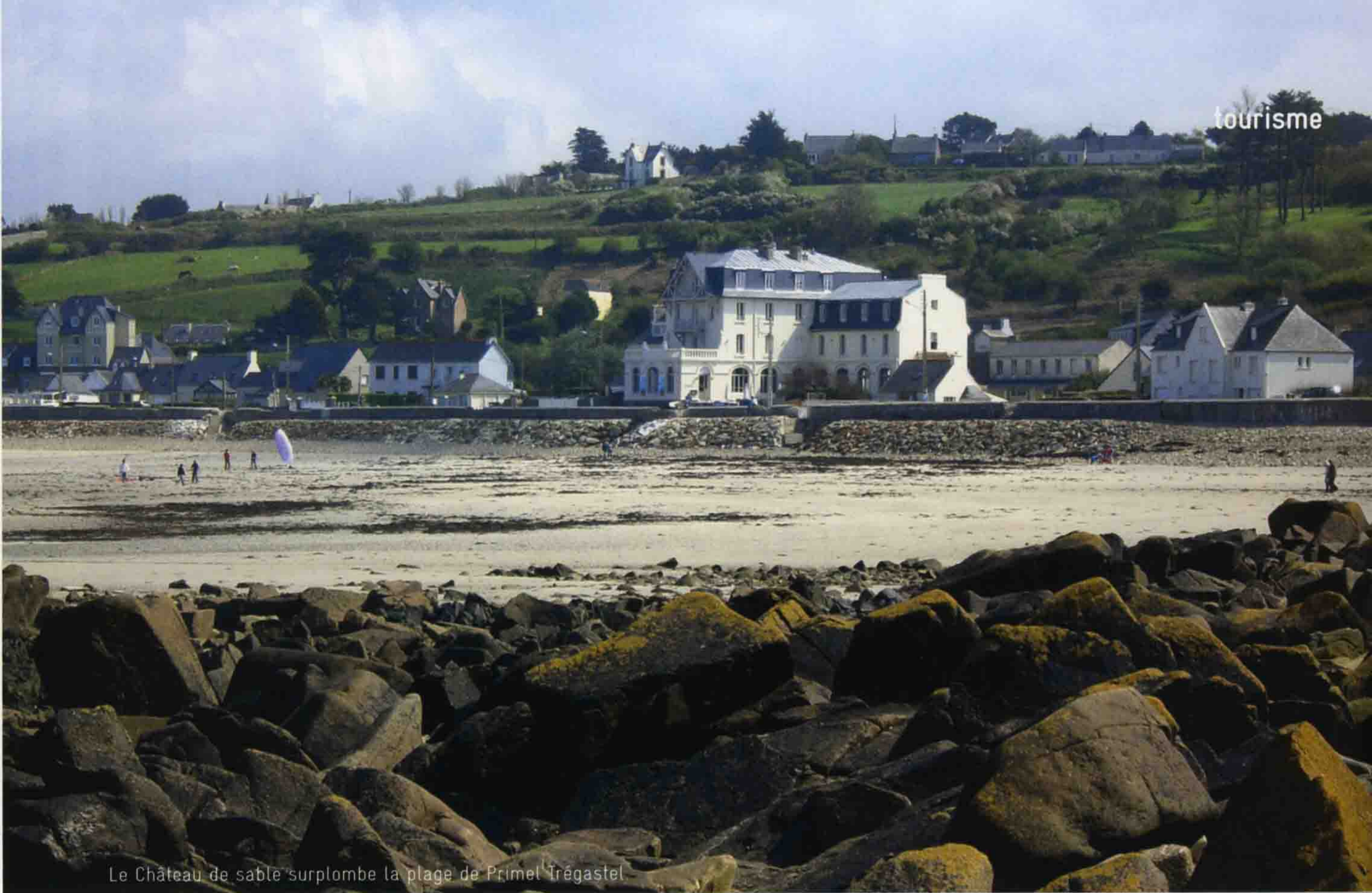
Le Château de sable surplombe la plage de Primel Trégastel